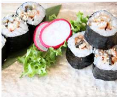
110. HOSOMAKI ANGUILLA CETRIOLO / € 5.00