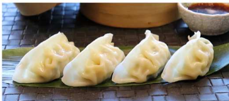
04. RAVIOLI AL VAPORE / € 3.00 [ pollo, verdure ]