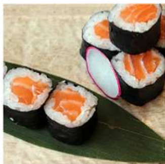
103. HOSOMAKI SALMONE / € 5.00