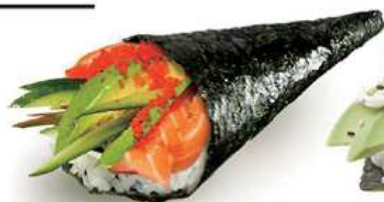
128. TEMAKI SALMONE / € 4.00