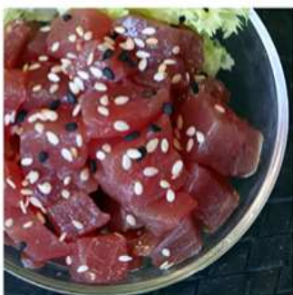
19. MAGURO TARTARE / € 9.00 [ tonno, avocado tagliato ]