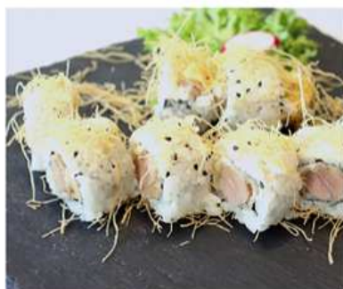
88. TONNO TEMPURA MAKI / € 12.00 [ tonno fritto, philadelphia, tempura di patate ]