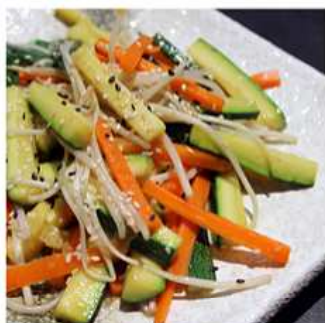
71. VERDURE ALLA PIASTRA / € 5.00