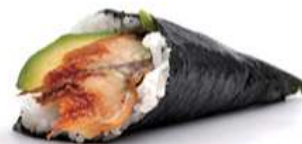
135. TEMAKI UNAGHI / € 4.00