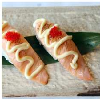
118. SALMONE SCOTTATO / € 3.50