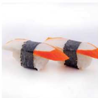
126. SURIMI / € 3.00