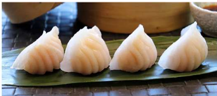
05. RAVIOLI HARKAO AL VAPORE / € 3.00 [ verdure, gamberi ]