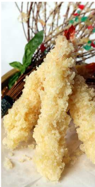
23. EBI TEMPURA / € 10.00 [ gamberi fritti - 3 pz. ]