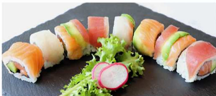
77. ARCOBALENO MAKI / € 12.00 [ INTERNO: salmone e avocado - ESTERNO: pesce misto ]