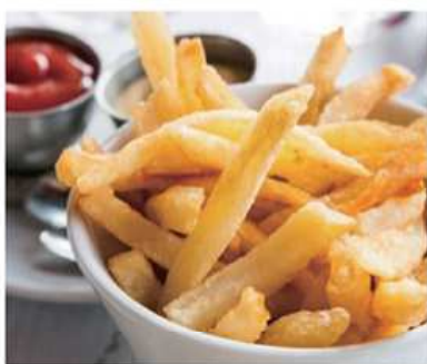
08. PATATINE FRITTE / € 2.00