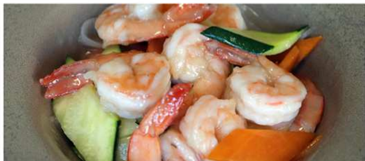
59. GAMBERI CON VERDURA / € 6.00 [ gamberi con verdure miste ]