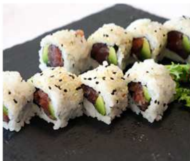
90. SPICY TONNO MAKI / € 8.00 [ tartare di tonno piccante, avocado ]