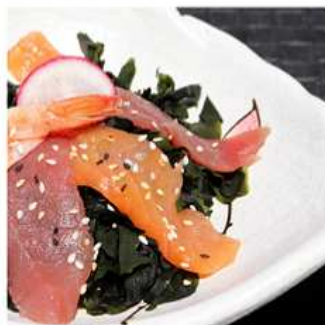
14. SUNOMONO / € 5.00