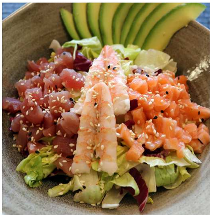
16. INSALATA DI PESCE / € 8.00

N.B: I prodotti presenti in menù sono da considerarsi surgelati all'origine. Per i prodotti freschi, chiedere al personale in sala