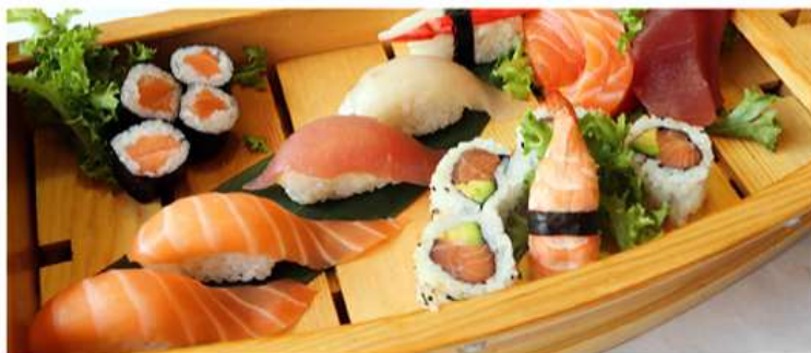
139. BARCA PICCOLA / € 18.00 [ 6 nigiri, 4 hosomaki, 4 uramaki, 6 sashimi ]