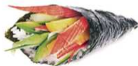
136. TEMAKI GRANCHIO / € 4.00