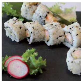
93. TEMPURA MAKI / € 8.00 [ gamberi fritti ]