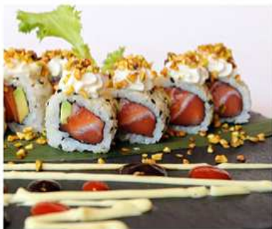
80. PISTACCHIO MAKI / € 10.00 [ salmone, avocado, philadelphia, pistacchio ]