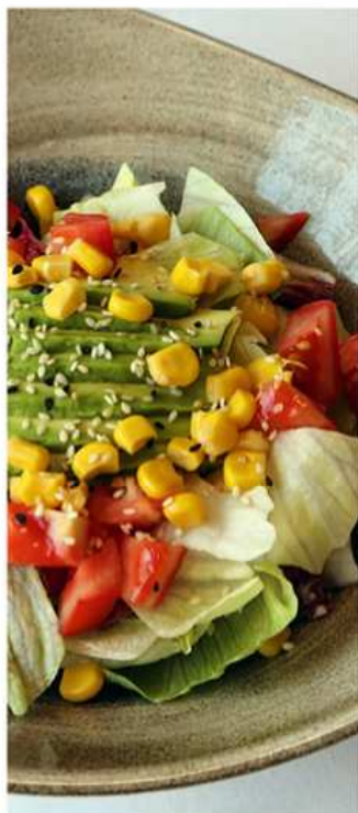
17. YASA INSALATA / € 5.00