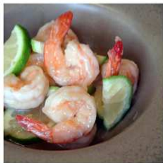
60. GAMBERI AL LIMONE / € 6.00 [ gamberi, limone ]