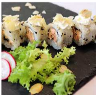
83. SPECIALE MIURA MAKI / € 10.00 [ salmone cotto, philadelphia, mandorla ]