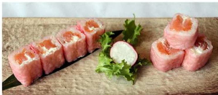
108. HOSOMAKI SALMONE PHILADELPHIA / € 8.00