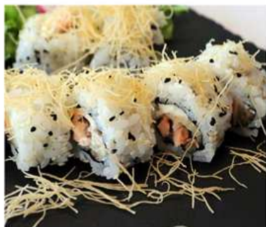
84. SAKE TEMPURA MAKI / € 12.00 [ salmone fritto, philadelphia, tempura di patate ]