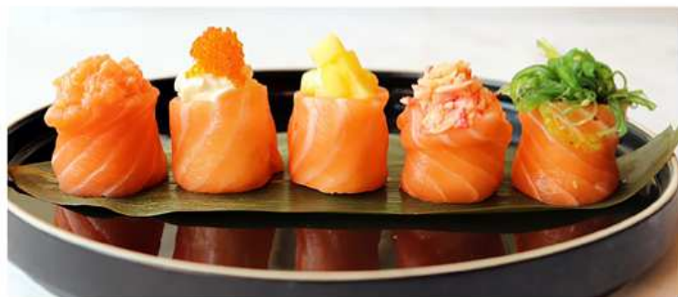
159. GUNKAN MISTO / 5 PZ. / € 10.00