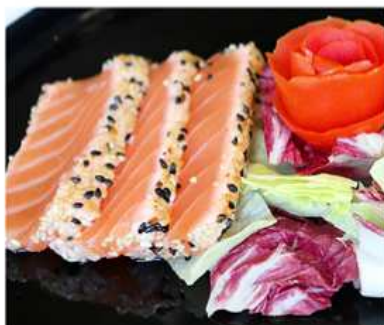
18. SAKE TATAKI / € 10.00 [ salmone a tranci con sesamo ]