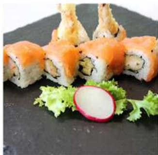
95. TIGER MAKI / € 12.00 [ tempura di gamberi e salmone ]