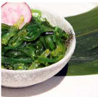
12. GOMA WAKAME / € 4.00