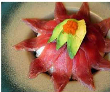
161. TAKITON TONNO / € 8.00