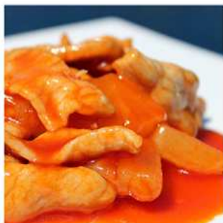
49. POLLO AGRODOLCE / € 6.00 [ pollo, ananas ]