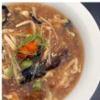
21. ZUPPA AGRO PICCANTE / € 3.00 [ tofu, funghi, piselli, tritato di maiale ]