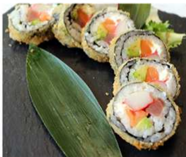
114. MAKI FRITTO / € 10.00 [ salmone, tonno, surimi, avocado, philadelphia ]