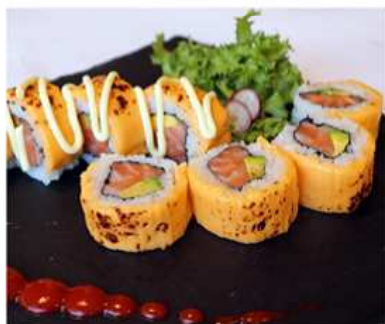
86. CHEDDAR SAKE MAKI / € 12.00 [ cheddar, salmone, avocado ]