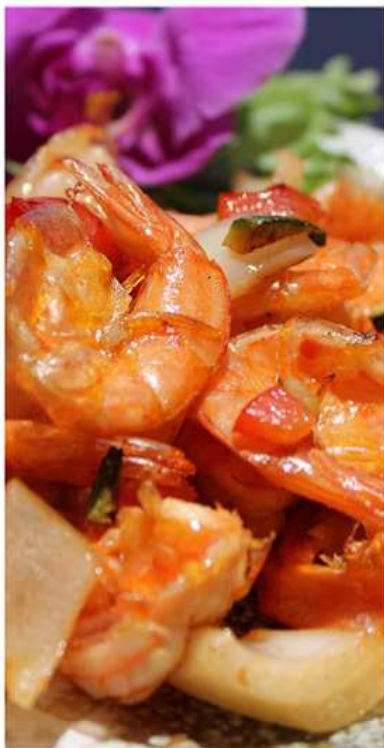
62. GAMBERI CON / € 6.00 AROMI GIAPPONESI