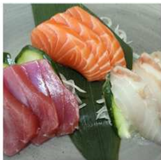
144. SASHIMI MISTO / € 10.00