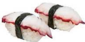
123. POLPO / € 3.00