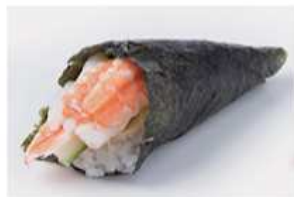
134. TEMAKI GAMBERI COTTI / € 4.00