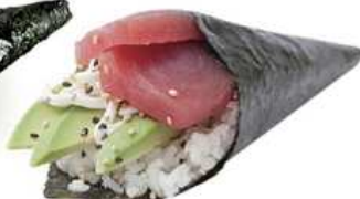
129. TEMAKI TONNO / € 4.00