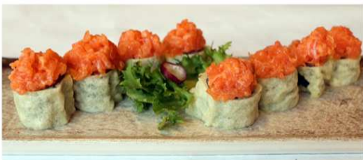
117. HOSO SPICY FRITTO / € 8.00 [ avocado, spicy salmone ]