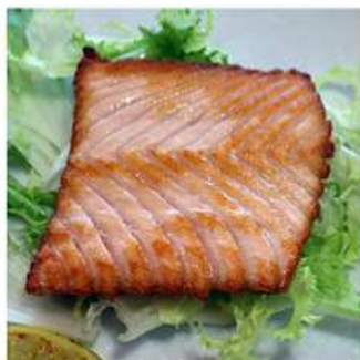
68. SALMONE PIASTRATO / € 10.00