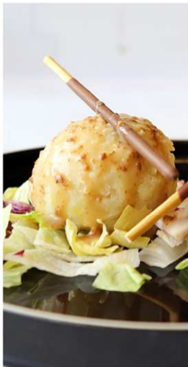
11. INSALATA DI PATATE / € 5.00