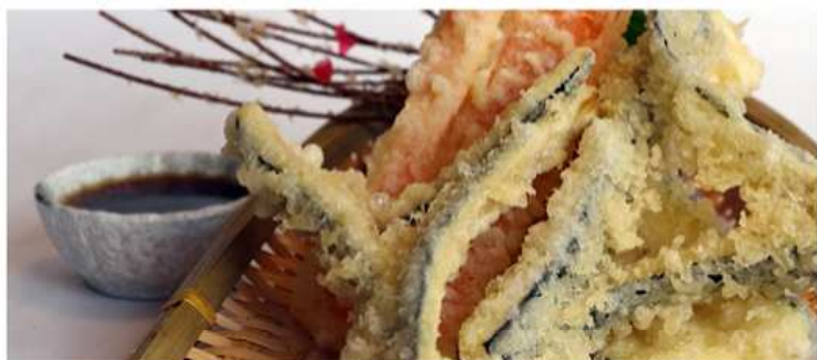
24. YASAI TEMPURA / € 8.00 [ fritto di verdure miste - 6 pz. ]