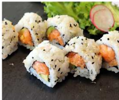
74. SPICY SALMONE MAKI / € 8.00 [ tartare di salmone piccante e avocado ]