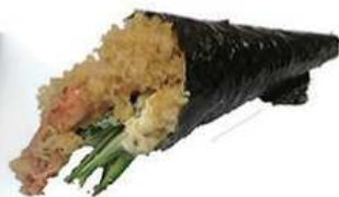
133. TEMAKI TEMPURA GAMBERI / € 4.00