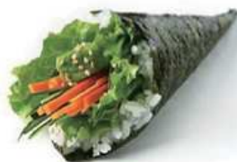
132. TEMAKI VEGETARIANI / € 4.00