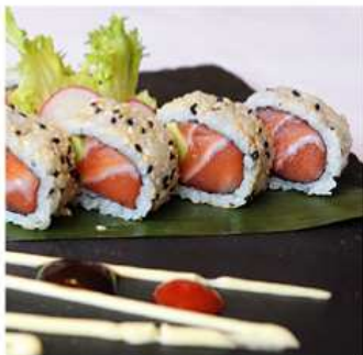
73. SALMONE AVOCADO MAKI / € 8.00 [ salmone, avocado ]