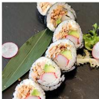
113. FUTOMAKI COTTO / € 7.00 [ salmone cotto, granchio, philadelphia, avocado ]