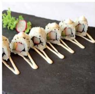
91. CALIFORNIA MAKI / € 8.00 [ surimi di granchio, avocado e maionese ]