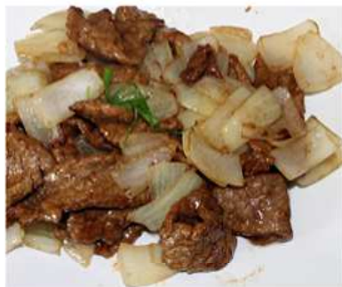
58. VITELLO ALLA PIASTRA / € 6.00 [ vitello, cipolla ]