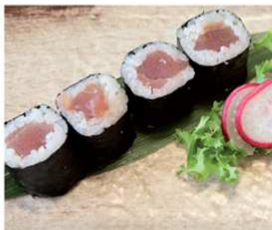
104. HOSOMAKI TONNO / € 5.00