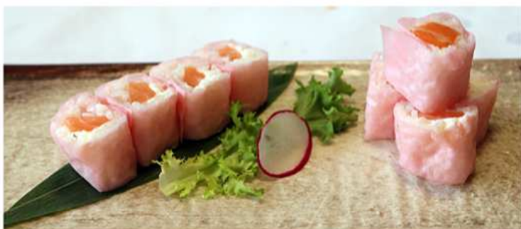
107. HOSOMAKI SALMONE AFFUMICATO / € 8.00 [ salmone affumicato, philadelphia ]