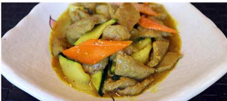
56. VITELLO AL CURRY / € 6.00 [ vitello, verdure, curry ]