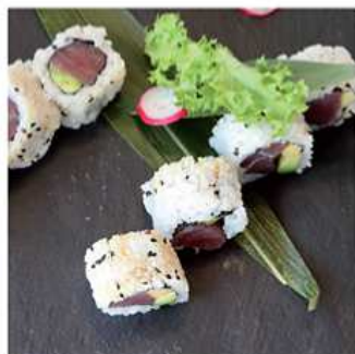
89. TONNO AVOCADO MAKI / € 8.00 [ tonno, avocado ]