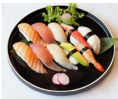
127. NIGIRI MISTO (6PZ.) / € 8.00