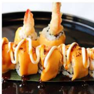
97. CHEDDAR TEMPURA MAKI / € 12.00 [ gamberi fritti, cheddar ]