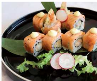
96. DRAGON MAKI / € 12.00 [ tempura di gamberi, salmone scottato ]