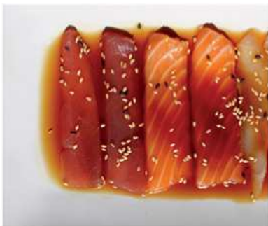
145. CARPACCIO MISTO / € 8.00