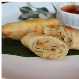
01. INVOLTINI PRIMAVERA / € 2.50 [ verdure miste ]