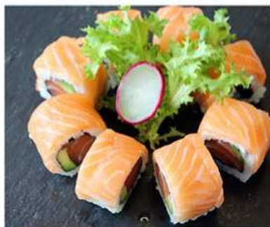
76. SAKE MAKI / € 12.00 [ INTERNO: salmone e avocado - ESTERNO: salmone ]