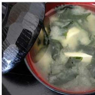
22. MISOSHIRU / € 3.00