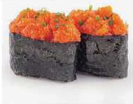
150. GUNKAN SPICY SALMONE / € 4.00