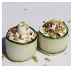
155. GUNKAN VEGETARIANI / € 4.00 [ cetriolo, philadelphia, pistacchio ]