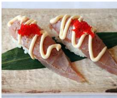
119. TONNO SCOTTATO / € 3.50