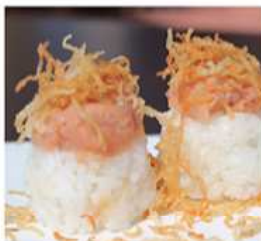
157. GUNKAN MAGURO / € 4.00 [ bocconcini di riso con tartare di tonno ]