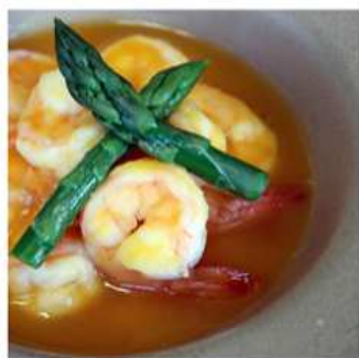
61. GAMBERI D'ORO / € 6.00 [ gamberi, asparagi, zucca ]