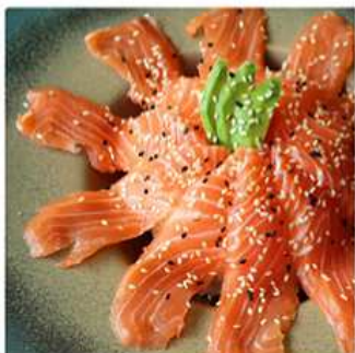
160. SAKETON SALMONE / € 8.00

N.B.: I prodotti presenti in menù sono da considerarsi surgelati all'origine. Per i prodotti freschi, chiedere al personale in sala