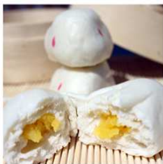
07. PANE DI CONIGLIO / € 3.00 [ pane dolce cinese con crema all'uovo ]