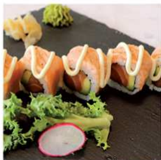
85. HOT SAKE MAKI / € 12.00 [ INTERNO: salmone, avocado ESTERNO: salmone scottato ]