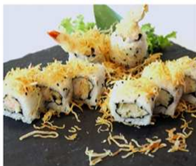
94. KUNI MAKI / € 12.00 [ gamberi fritti e tempura di patate ]