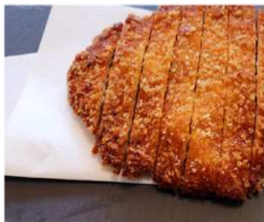
55. TONKATSU / € 6.00 [ maiale fritto ]