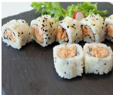
82. MIURA MAKI / € 8.00 [ salmone cotto, philadelphia ]