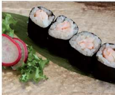
106. HOSOMAKI GAMBERI COTTI / € 5.00