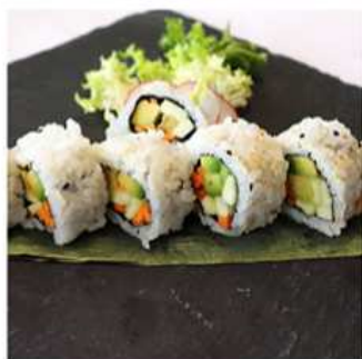
99. YASAI MAKI / € 8.00 [ verdura mista ]