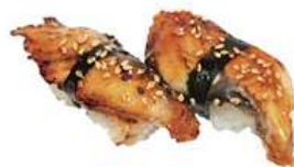
125. UNAGHI / € 3.50