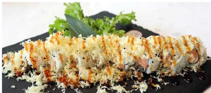
78. MAKI UMI / € 10.00 [ salmone, avocado, philadelphia e tempura ]