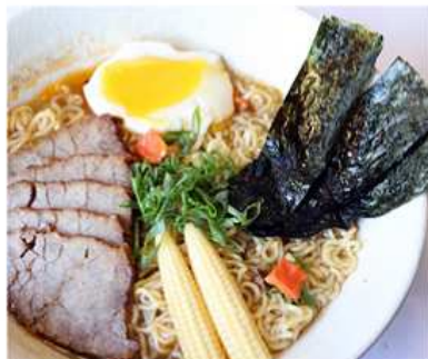
45. RAMEN CON VITELLO / € 8.00