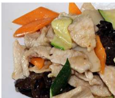
50. POLLO CON VERDURE / € 6.00 [ pollo, verdure miste ]