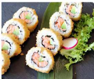
100. URAMAKI FRITTO / € 10.00 [ salmone, avocado, philadelphia ]