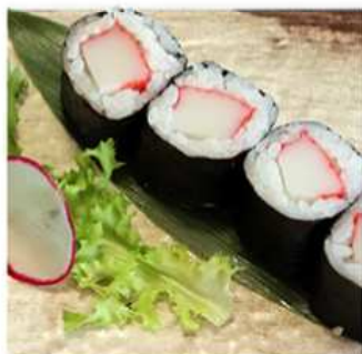
105. HOSOMAKI SURIMI / € 5.00