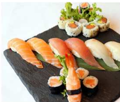
138. SUSHI MISTO GRANDE / € 20.00 [ 8 nigiri, 8 hosomaki, 4 uramaki ]