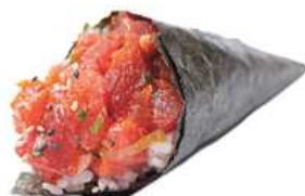
130. TEMAKI SPICY TONNO / € 4.00