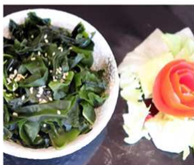
13. WAKAME SALADA / € 4.00