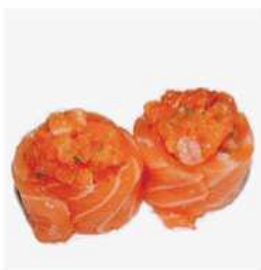
153. GUNKAN SALMONE / € 5.00