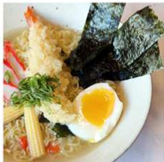
44. RAMEN CON GAMBERI / € 8.00 [ spaghetti giapponesi in brodo con gamberi, uova e wakame ]