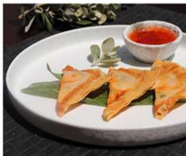
02. INVOLTINI DI GAMBERI / € 3.00 [ gamberi, piselli ]