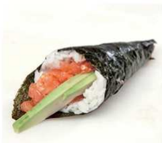
131. TEMAKI SPICY SALMONE / € 4.00