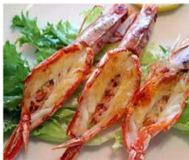
64. GAMBERI ALLA PIASTRA / € 5.00