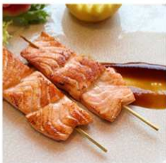
65. SALMONE GRIGLIATO / € 5.00