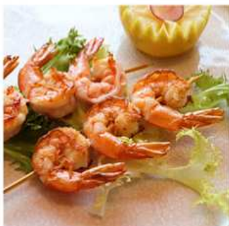
63. GAMBERI GRIGLIATI / € 5.00