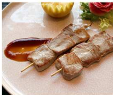
66. TONNO GRIGLIATO / € 5.00