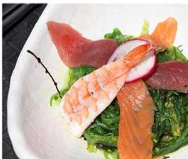
15. GOMA WAKAME DI PESCE / € 5.00