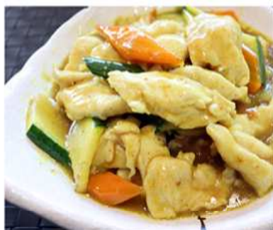
48. POLLO AL CURRY / € 6.00 [ pollo e verdure ]