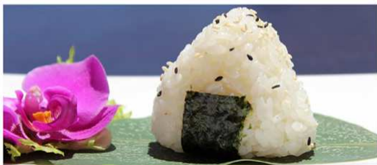
147. ONIGIRI SALMONE COTTO / € 5.00