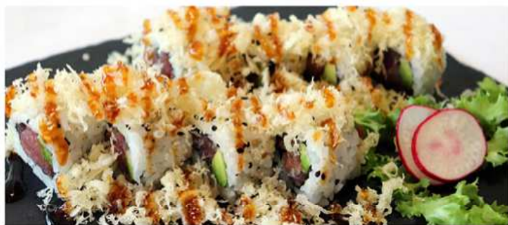
102. UMI SPICY TONNO MAKI / € 10.00 [ tonno piccante, avocado, tempura ]