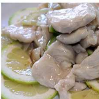
47. POLLO AL LIMONE / € 6.00