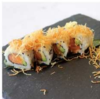
79. CANADIAN MAKI / € 10.00 [ salmone, avocado, tempura di patate ]

N.B: I prodotti presenti in menù sono da considerarsi surgelati all'origine. Per i prodotti freschi, chiedere al personale in sala