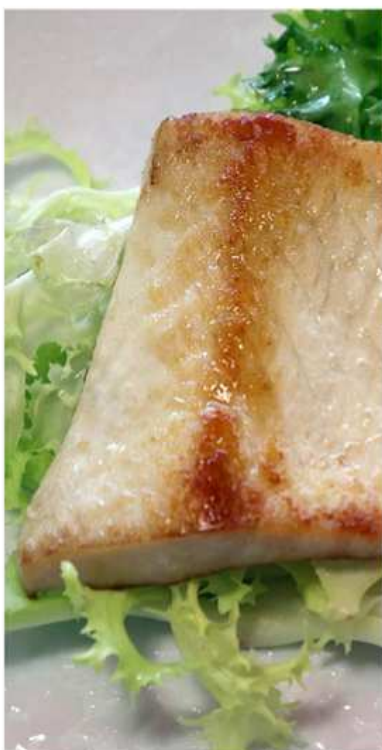
70. PESCE SPADA PIASTRATO / € 10.00