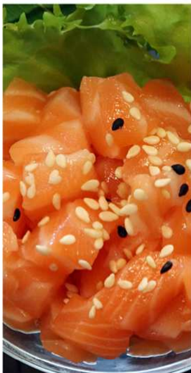
20. SAKE TARTARE / € 9.00 [ salmone, avocado tagliato ]