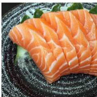
142. SASHIMI SALMONE / € 8,00