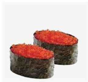
152. GUNKAN TOBIKO / € 4.00