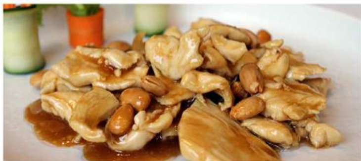
46. POLLO ALLE MANDORLE / € 6.00