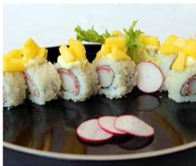
92. SURIMI TEMPURA MAKI / € 12.00 [ surimi di granchio fritto, mango e tempura ]