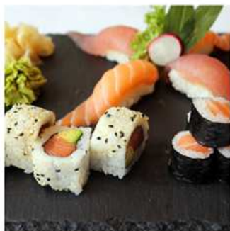
137. SUSHI MISTO PICCOLO / € 12.00 [ 4 nigiri, 4 hosomaki, 4 uramaki ]