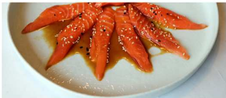
146. CARPACCIO DI SALMONE / € 7.00

N.B.: I prodotti presenti in menù sono da considerarsi surgelati all'origine. Per i prodotti freschi, chiedere al personale in sala