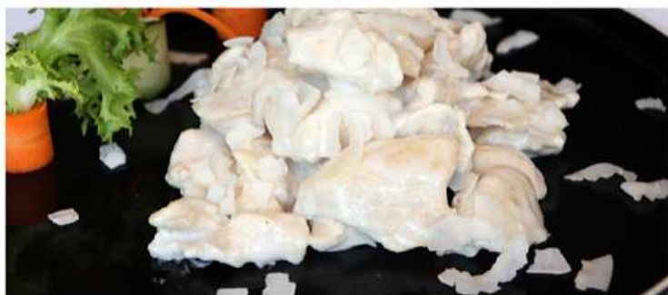
53. POLLO AL COCCO / € 6.00