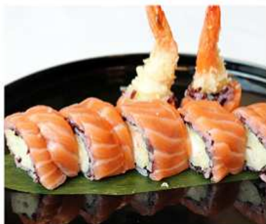
98. BLACK TIGER MAKI / € 12.00 [ riso nero, gamberi fritti e salmone ]