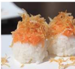
29 156. GUNKAN SAKE / € 4.00 [ bocconcini di riso con tartare di salmone ]