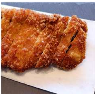
54. TONKATSU DI POLLO / € 6.00 [ pollo fritto ]