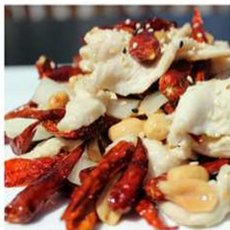
51. POLLO PICCANTE / € 6.00