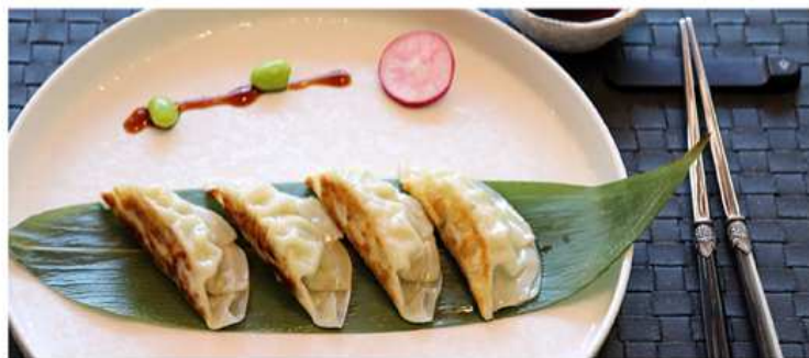
03. RAVIOLI ALLA GRIGLIA / € 3.00 [ pollo, verdure ]