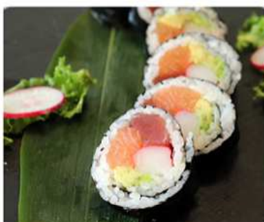
112. FUTOMAKI MIX / € 7.00 [ salmone, tonno, surimi di granchio ]