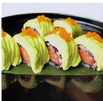
87. BLACK SAKE MAKI / € 12.00 [ riso nero, salmone, avocado ]