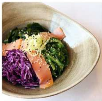
10. TRIS INSALATA CON / € 7.00 SALMONE AFFUMICATO [ alghe, cavolo cappuccio rosso, salmone ]