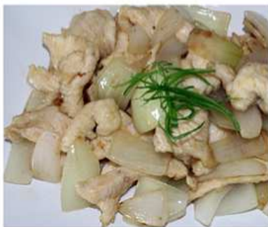
52. POLLO ALLA PIASTRA / € 6.00 [ pollo, cipolla ]