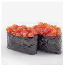
151. GUNKAN SPICY TONNO / € 4.00