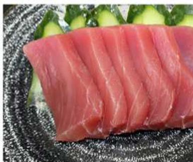
143. SASHIMI TONNO / € 8,00