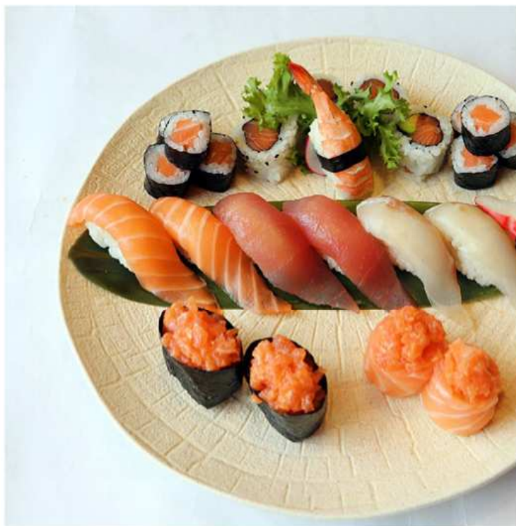
141. UMI SUSHI MISTO / € 25,00 [ 8 nigiri, 8 hosomaki, 4 uramaki, 4 gunkan ]