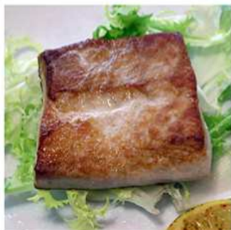
69. TONNO PIASTRATO / € 10.00