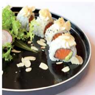
81. MANDORLA MAKI / € 10.00 [ salmone, avocado, philadelphia, mandorla ]