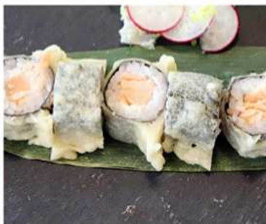
116. HOSO SAKE FRITTO / € 6.00 [ salmone, philadelphia ]