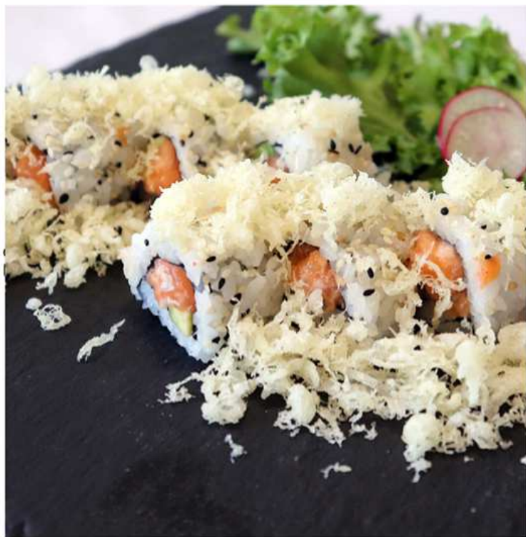
101. UMI SPICY SALMONE MAKI / € 10.00 [ salmone piccante, avocado, tempura ]