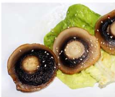
72. FUNGHI ALLA GRIGLIA / € 4.00