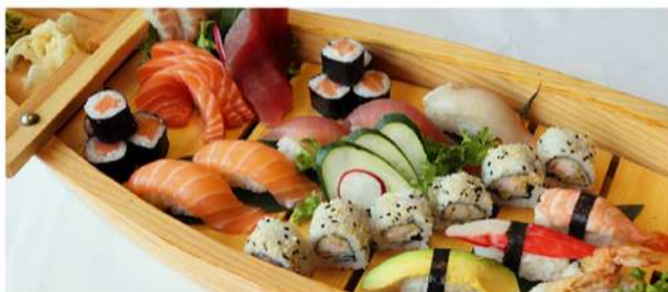
140. BARCA LOVE / € 32.00 [ 8 nigiri, 8 hosomaki, 8 uramaki, 9 sashimi ]