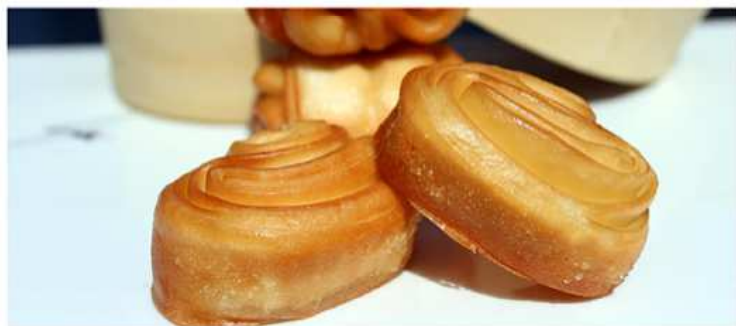
06. PANE FRITTO / € 3.00 [ pane cinese ]