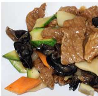
57. VITELLO CON VERDURE / € 6.00 [ vitello, verdure miste ]