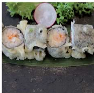
115. HOSOMAKI FRITTO / € 6.00 [ gamberi cotti, philadelphia ]