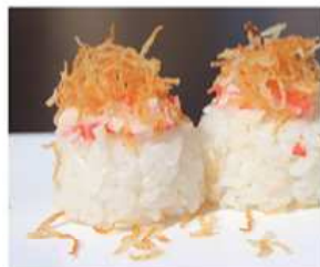
158. GUNKAN SURIMI / € 4.00 [ bocconcini di riso con tartare di granchio ]