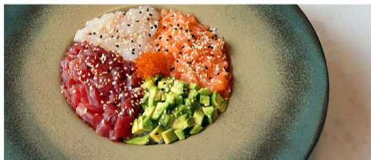
162. CIRASHI MISTO / € 8.00