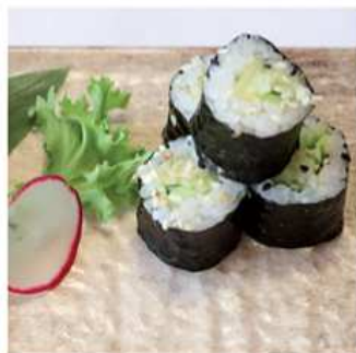
109. HOSOMAKI CETRIOLO / € 4.00

N.B.: I prodotti presenti in menù sono da considerarsi surgelati all'origine. Per i prodotti freschi, chiedere al personale in sala