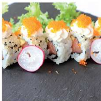
75. PHILADELPHIA MAKI / € 8.00 [ salmone, philadelphia e avocado ]