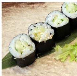
111. HOSOMAKI AVOCADO / € 4.00