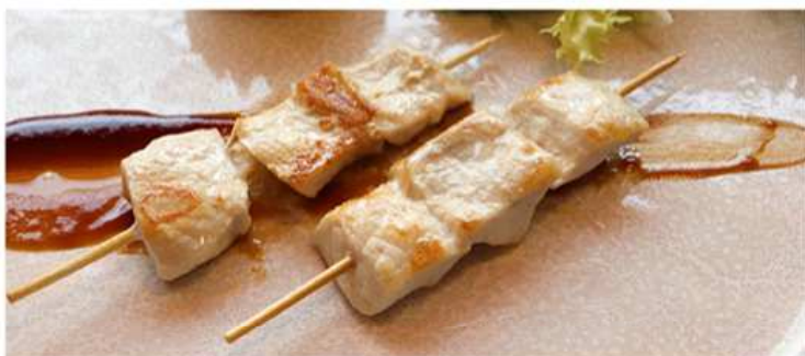
67. PESCE SPADA GRIGLIATO / € 5.00