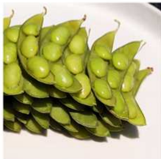
09. EDAMAME / € 3.00 [ fagioli di soia bolliti ]